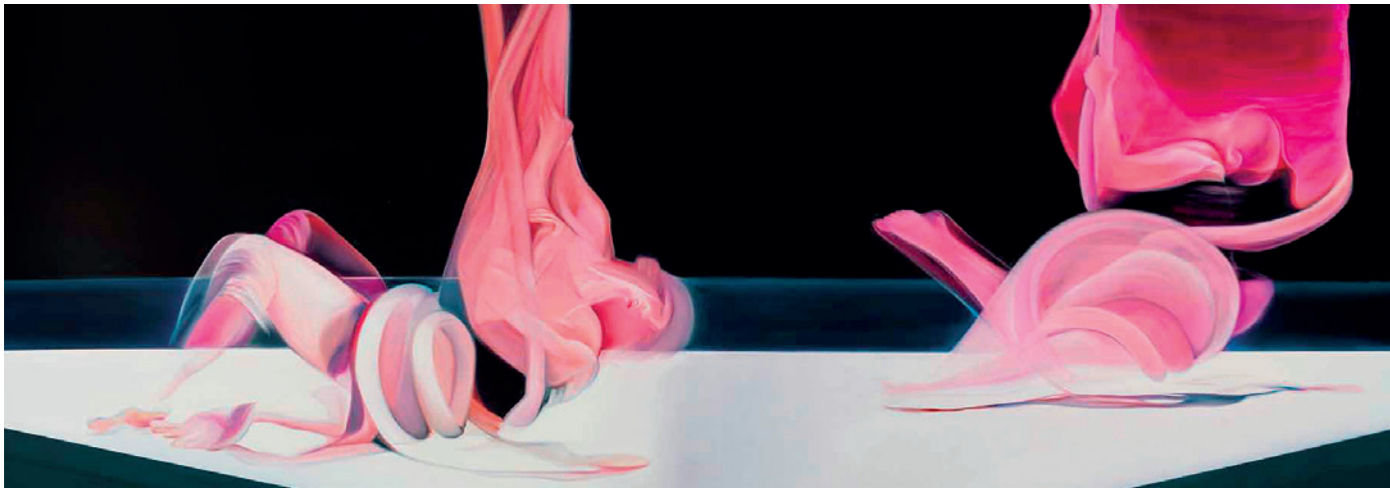
Csurka Eszter: Cím nélkül , 2009, olaj, vászon, vegyes technika, 200×300 cm (részlet)